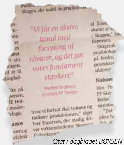
Citat i dagbladet BØRSEN

duktudvikling, og det skaber en række synergier.