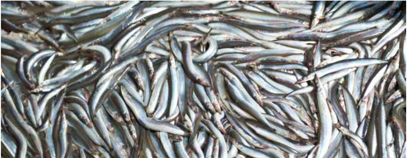
Den proteinrige tobis er i fokus i den fiskeripolitiske debat som branchens vigtigste industrifisk.